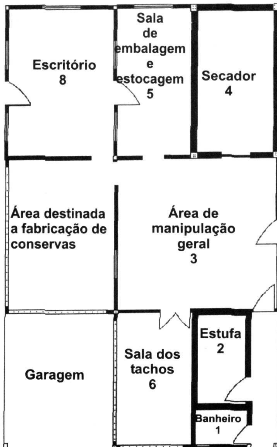
Figura 1. Croquis da Unidade de Transformação dos produtos Agrícolas de Batuva.